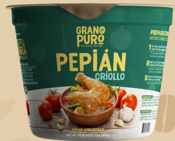
Pepián Criollo 32 oz 12 Uni/Case