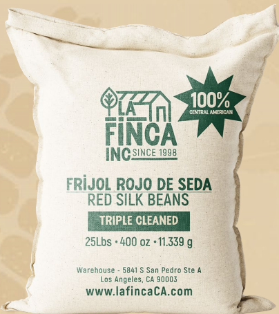
Frijol Rojo de Seda Triple cleaned Saco 25 Lb