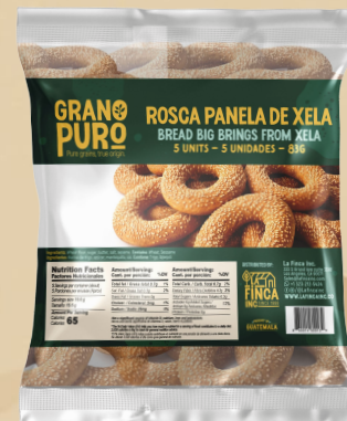
Rosca Panela Xela 24 Uni/Case