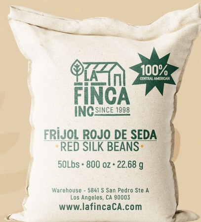
Frijol Rojo de Seda Saco 50 Lb