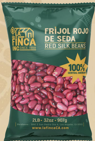
Frijol Rojo de Seda 2 Lb