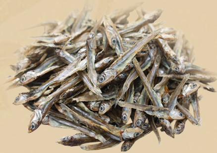
Manjua Dried Small Fish 454 gr - 2 oz