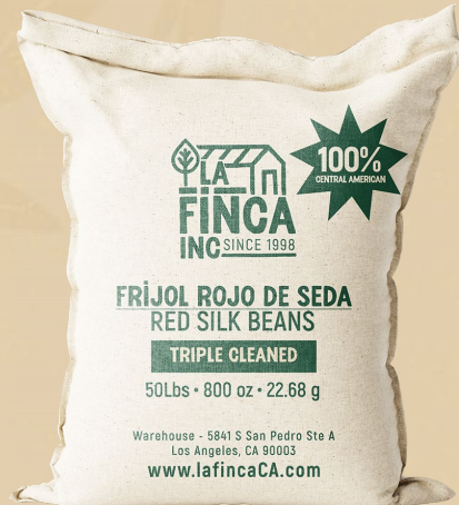
Frijol Rojo de Seda Triple cleaned Saco 50 Lb