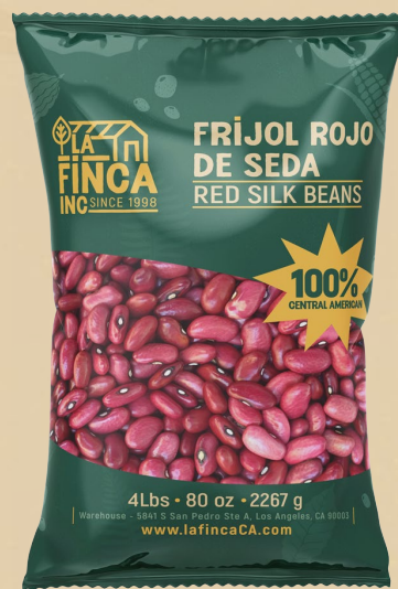
Frijol Rojo de Seda 4 Lb