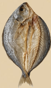
Pargo Gris 454 gr