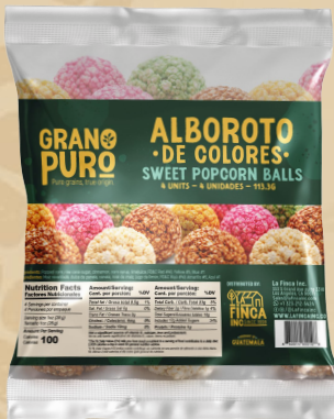
Alboroto de Colores 20 Uni/Case