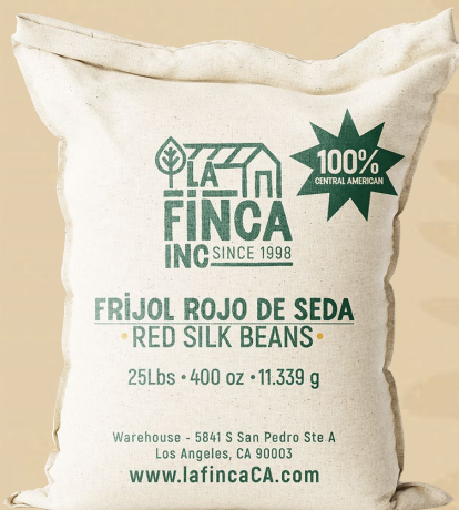
Frijol Rojo de Seda Saco 25 Lb