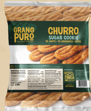
Churro Sugar Cookie 24 Uni/Case