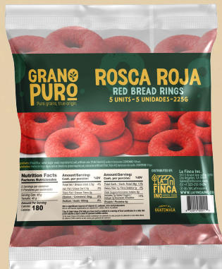
Rosca Roja 24 Uni/Case