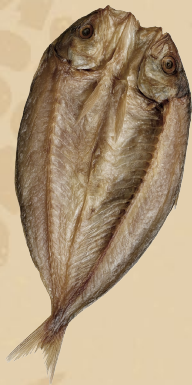
Macarela Dried Fish 454 gr